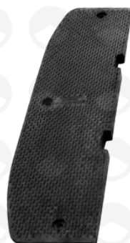
Cabecero hembra 23501VTR