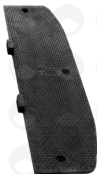
Cabecero macho 23502VTR