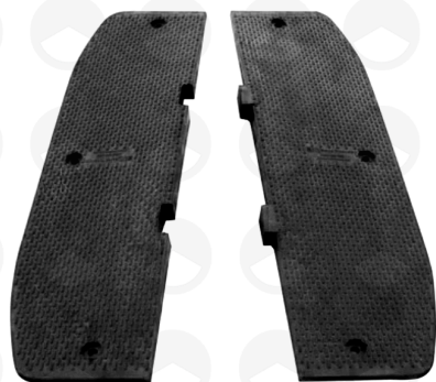
CABECERO MACHO 23502VTR